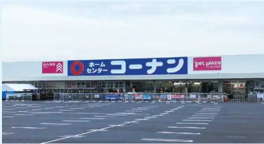
2019年11月に愛媛県新居浜市にオープンした「新居浜店」

幅広い品揃え、地域密着型のホームセンターです。お値打ち価格で役に立つ生活必需品をお届けすることでお客様の利便性を追求するとともに、DIY、ガーデニングなどでの余暇の活用により生活に彩りを添え、快適な住まいの実現を後押ししています。また近年では都市型モデル店舗出店など新たな取り組みも行っています。