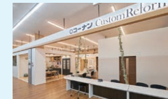
堺高須店の CustomReform 堺ショールーム

コーナンのリフォームコーナーでは、住宅設備の取替え工事や、カーポート・テラスなどのエクステリア工事についてさまざまなご相談にお応えしています。また新ブランド「コーナン CustomReform」を一部店舗で立ち上げ、個々の住空間やご希望に合わせた特別なリフォームの提供を目指しています。