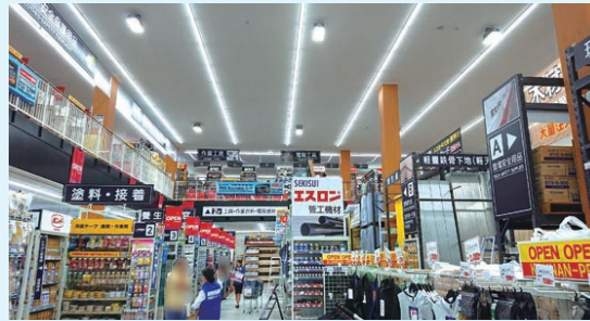
新たな売場構造を採用した、京都市南区の「PRO東寺南店」

プロのお客様の厳しい目に応える専門性の高い資材、塗料、作業用品などを幅広く品揃えするプロ向け専門店です。近年は工具や作業着などに特化したプロ向け小型店「WORK&TOOL」という業態の出店を強め、またコーナンPROでは新しい試みである、二階建て吹き抜け構造を採用した店舗の出店も増やしています。