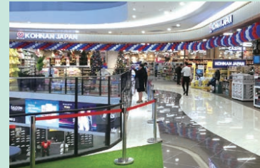
2019年12月にハノイ市にオープンした「ハドン店」

コーナンベトナムは2019年12月に5号店をオープンし、ハノイへはじめて出店しました。今後も出店を続け、ベトナムの急速な経済成長とともにベトナム社会の一員として成長していきます。