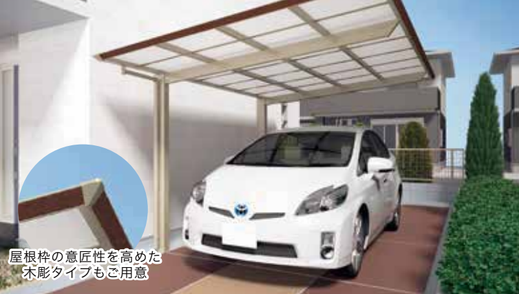
屋根枠の意匠性を高めた 木彫タイプもご用意