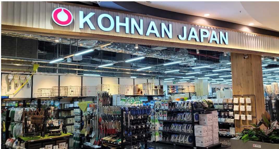
【コーナンジャパン センソックシティ店】

「センソックシティ店」は、カンボジアの首都であるプノンペン市中心部の北部にある、大型商業施設「AEON MALL Sen Sok City」内にオープンいたしました。