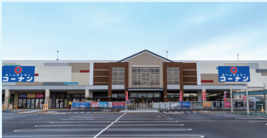
(上) 2023年3月にオープンした「上天神中央通店」 (下) 2023年4月にオープンした「イオン長浜店」

幅広い品揃え、地域密着型のホームセンターです。お値打ち価格で役に立つ生活必需品をお届けすることでお客様の利便性を追求するとともに、DIY、ガーデニングなどでの余暇の活用により生活に彩りを添え、快適な住まいの実現を後押ししています。また近年ではフォーマット戦略として駅前の複合商業施設内への出店やPRO+ホームセンターのハイブリッド店舗の出店など新たな取り組みを行っています。