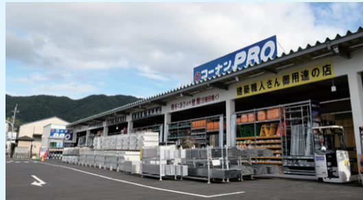
2023年8月にオープンした「PRO外環八尾山本店」

プロのお客様の厳しい目に応える専門性の高い資材、塗料、作業用品などを幅広く品揃えするプロ向け専門店です。近年は売場面積300坪～500坪クラスの小型店の出店も強化し、都市部でも出店しやすい店作りで幅広い店舗展開を行っています。