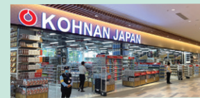
2023年7月にオープンした「ソラガーデン店」(ベトナム ビンズン省)

2022年7月、カンボジア王国に1号店の「センソックシティ店」をオープン致しました。ベトナムに続き2カ国目の海外進出となりました。ベトナムにおいても今期新たに2店舗をオープン致しました。今後も更なる事業規模拡大を目指してまいります。