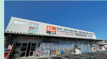
2023年3月にオープンした「建デポ 柏十余二店」

株式会社建デポは首都圏を中心に展開するプロ顧客向け会員制建築資材卸売業です。2019年6月に同社を当社グループに迎え入れ、とりわけ首都圏におけるプロ業態の店舗網が大いに充実し、2023年度の上期には新店を3店舗オープンしました。売上及び利益ともに着実に成長し、当社グループにとってますます重要な位置付けを占めるようになっていきます。新たな取組みとして、法人向けECサイト及び建築資材や道具のアウトレット店などの新規事業にもチャレンジしています。今後も売上ならびに安定収益を確保し、より一層当社グループのシナジー効果を創出できるよう継続的努力をまいります。