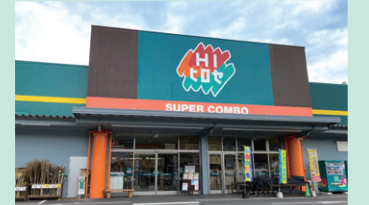
ホームセンターと食品スーパーを併設した「スーパーコンボ白杵店」

株式会社ホームインブルーメントひろせは、九州地方においてホームセンター、プロ及び食品店舗事業を32店舗展開しております。2023年6月に同社を当社グループに迎え入れ、九州における店舗網拡大につながりました。当社は、同社の強みを活かしたシナジー効果を創出し、九州のドミナント拡大と食品スーパー部門のノウハウ蓄積により更なる業容拡大を目指してまいります。