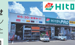
2025年7月にオープンした 「HiヒロセPRO下郡店」

ホームインブルームメントひろせ 九州地方においてホームセン ターと食品スーパーを併設した 店舗等を運営