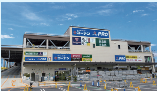
(上) 2025年9月にオープンした「東岸和田駅前店」 (下) 2025年12月にオープンした「江戸川船堀店」

幅広い品揃え、地域密着型のホームセンターです。お値打ち価格で役に立つ生活必需品をお届けすることでお客様の利便性を追求するとともに、DIY、ガーデニングなどでの余暇の活用により生活に彩りを添え、快適な住まいの実現を後押ししています。また近年ではフォーマット戦略として新規出店や既存店の改装でPRO+ホームセンターのハイブリッド店舗を積極的に展開し、お客様の回遊性向上と効率的な店舗運営を追求しております。