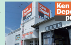
2025年9月にオープンした 「建デポ府中西原町店」

首都圏を中心としたプロ顧客向け 会員制建築資材卸売店舗 2025年度は石川県に初出店、 6店舗の新規出店を実施