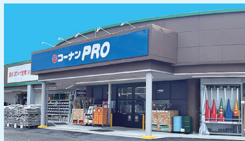
2025年11月にオープンした「PRO新潟桜木店」(新潟県初出店)

プロのお客様の厳しい目に応える専門性の高い資材、塗料、作業用品などを幅広く品揃えするプロ向け専門店です。建築需要が多い都市部を中心に小型店の出店を強化したり、既存店においてお客様の要望に合わせて柔軟に品揃えを変更するなど、幅広く柔軟な店舗展開を行っています。