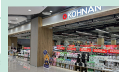
2025年12月にオープンした 「ピンコムオーシャンシティ店」