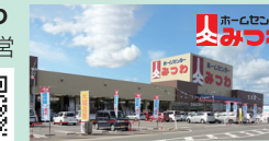
「ホームセンターみつわ丸岡店」