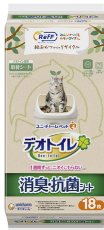
『デオトイレ消臭・抗菌シート RefF（リーフ）※』